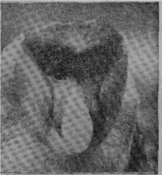
长 鼻 猴

而且变得“可以相对”，能够从手腕起旋转。虽然大多数灵长目都有这些特点，但是都比不上人那样可以完全控制。短尾猿在家谱中的地位很高。它的手在生理上高度进化，跟人一样。它的手指可以独立活动；大姆指可以相对；皮肤起皱形成指纹以便更好地拿东西。但是，短尾猿还不具备可以充分使用它的手的脑子。 对许多灵长目动物说来，它们的脚跟它们的手一样是有用的工具。它们的大脚趾和大姆指一样可以相对，它们的脚可以熟练地摄住和抓住物体。